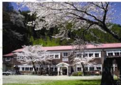
木造校舎「旧木沢小学校」