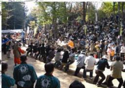
峠の国盗り綱引き「ヒョー越峠」(南信濃地区)