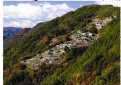
にほんの里100選、日本のチロル「下栗の里」