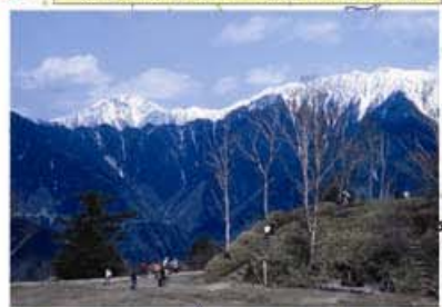
標高1918m、アルプス展望台しらびそ高原