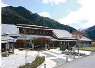
道の駅 遠山郷「かぐらの湯」