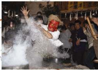
国の重要無形民俗文化財 800年の伝統を受け継ぐ「霜月祭り」(上村地区)